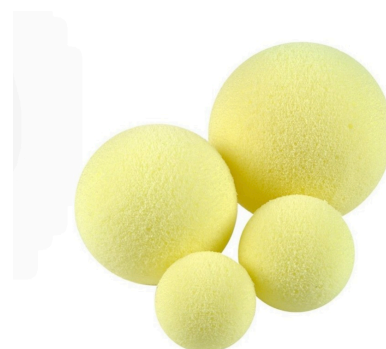
Terapeutický míček M2/M4

* Míčkem koulíme po obličeji jemně a jen s mírným tlakem. Každý tah zopakujeme 3x.